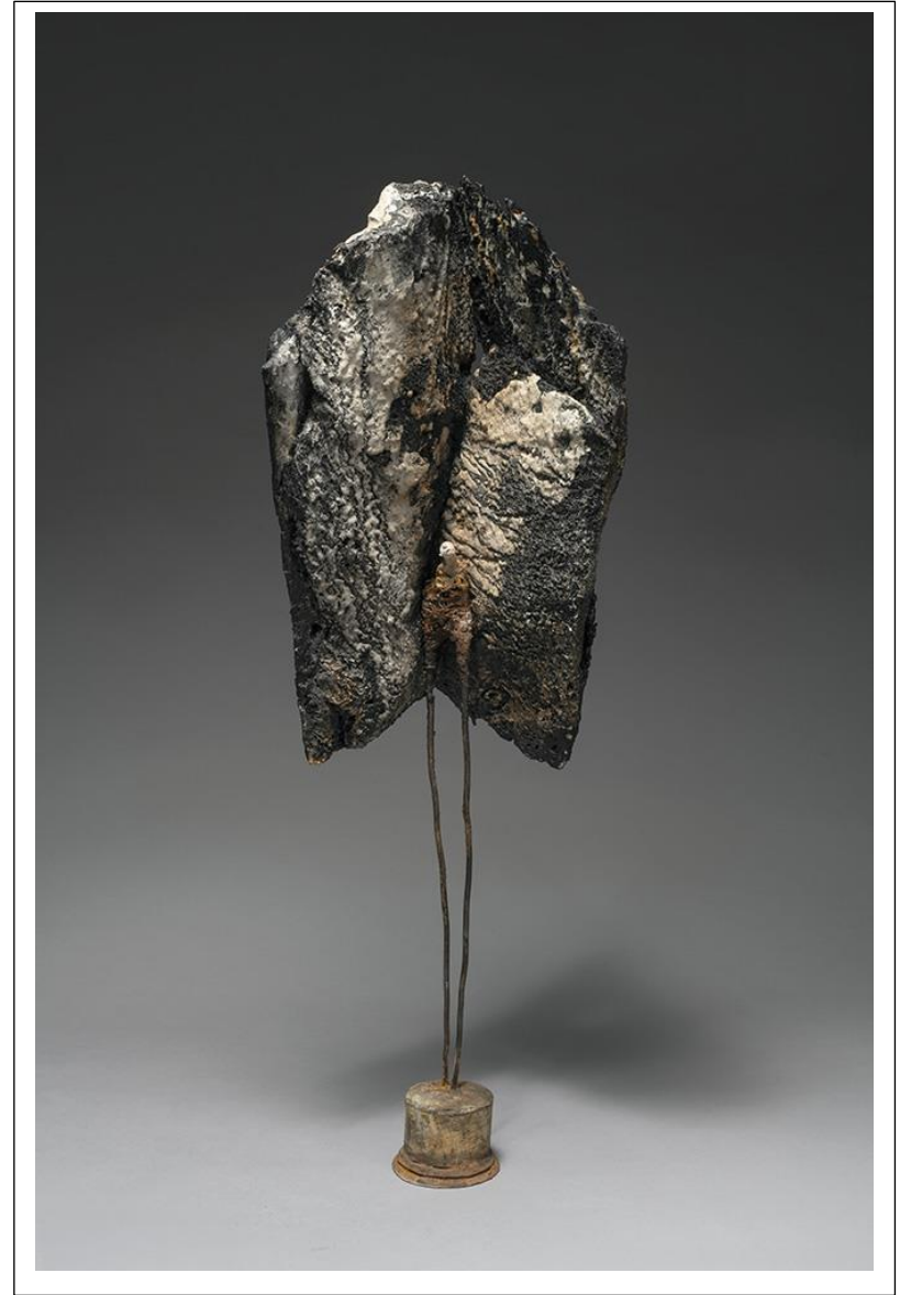
Un abri - 2021 - H 63 cm