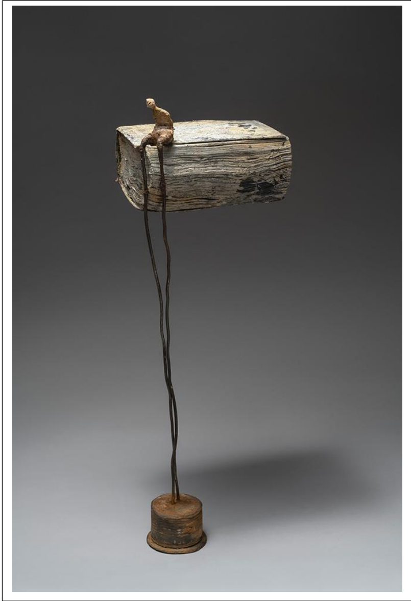
Le livre - 2021 - H 61 cm