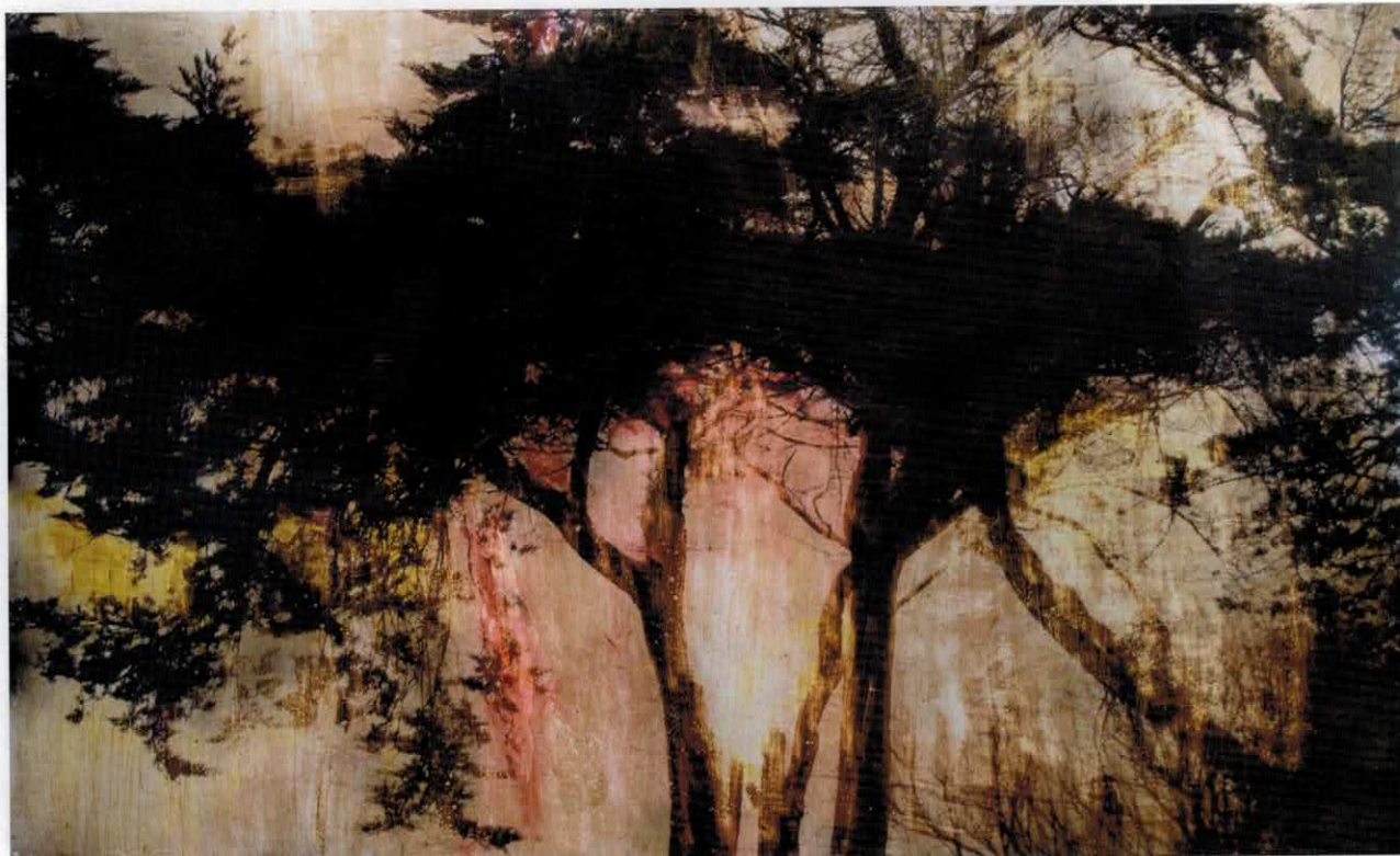
Sur le chemin, technique mixte, 2013